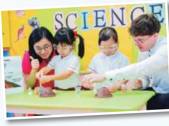
▲探索活動：建立學習動力