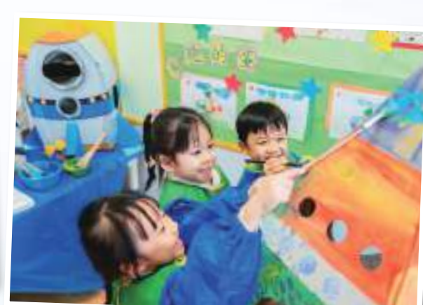
▲有趣視覺藝術活動