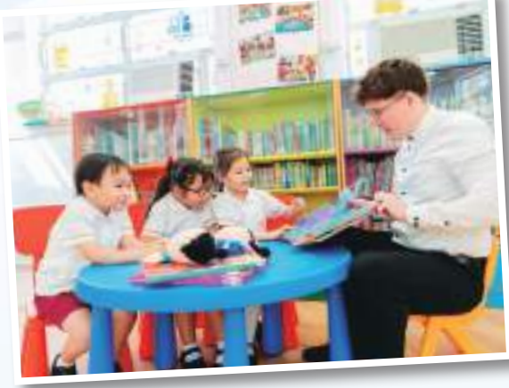
▲重視兩文三語，建立良好語文基礎

中華基督教會協和書院 地址：九龍慈雲山蒲崗村道171號 電話：2323 4265 傳真：2323 3258 電郵：info@ccchwc.edu.hk 網址：http://www.ccchwc.edu.hk