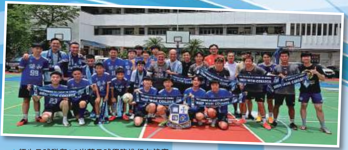
▲師生足球隊與AC米蘭足球學院進行友誼賽

協和學生「多元發展，成就閃耀」，音樂團隊多次獲全港冠軍，科學發展方面有學生曾多次於物理奧林匹