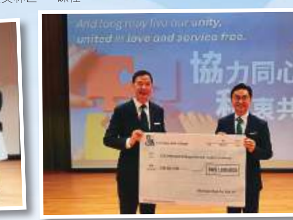
▲在科學室進行實驗，培養科學精神