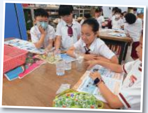
▲在科學室進行實驗，培養科學精神

本校原為中華基督教會協和小學上午校，二零一一年獲遷新校，正式改名為中華基督教會協和小學(長沙灣)。學校一直秉承「爾識真理、真理釋爾」的精神，作育英才，提供優質教育。